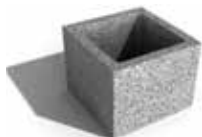
Leier beton pillérzsaluzó elem