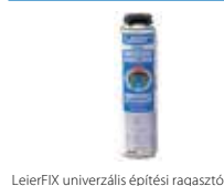
LeierFIX univerzális építési ragasztó