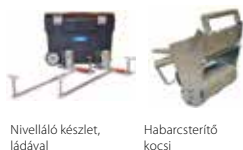
Nivelláló készlet, ládával