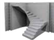
ELŐREGYÁRTOTT FALAK ÉS LÉPCSŐK